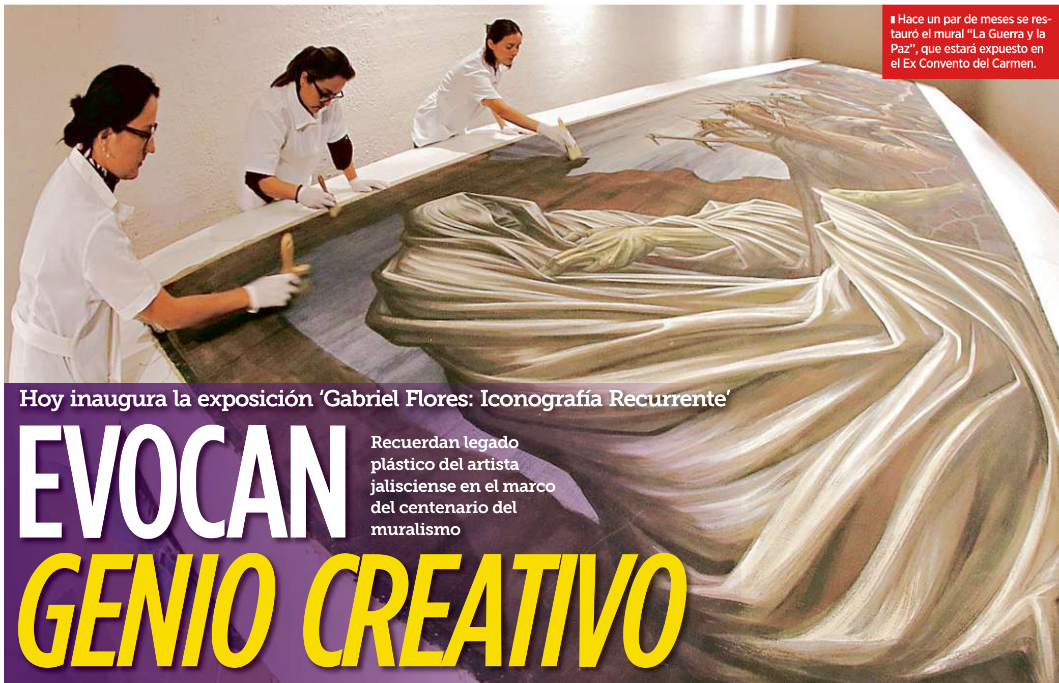
■ Hace un par de meses se restauró el mural "La Guerra y la Paz", que estará expuesto en el Ex Convento del Carmen.

Hoy inaugura la exposición 'Gabriel Flores: Iconografía Recurrente'