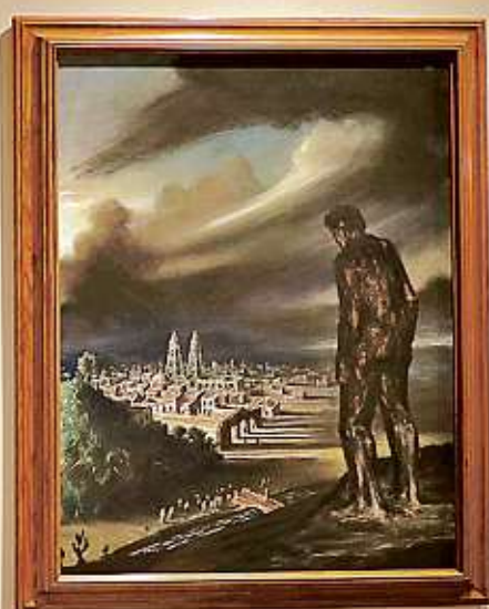
■ Aspectos de la exposición "Gabriel Flores: Iconografía recurrente", que estará montada a partir de este 20 de octubre de 2022.